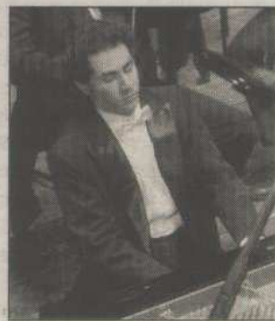
Il pianista Boris Feiner

Biglietti a 10, 8 e 6 euro. Per informazioni tel. 0161 255575.