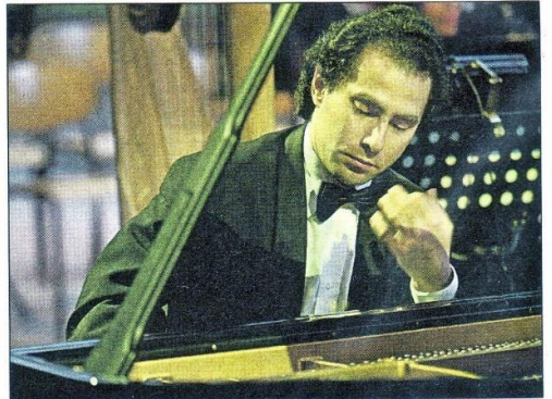
Der Klaviervirtuose Boris Feiner spielt in Kuppenheim für Flüchtlingskinder in Myanmar.

TdH Murgtal/Mittelbaden trägt 43 000 Euro an Aktionserlösen und Spenden zusammen